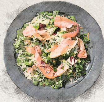
CAESAR SALAD WITH PROSCIUTTO AND KALE 生ハムとケールのシーザーサラダ 1,260yen (税込 1,386yen)