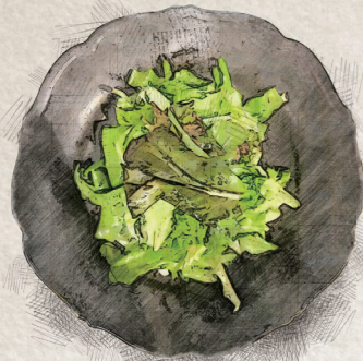
SIMPLE GREEN SALAD シンプルグリーンサラダ 880yen (税込 968yen)