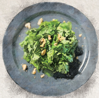
CORIANDER SALAD パクチーサラダ 980yen (税込 1,078yen)