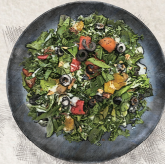
COLORFUL VEGETABLES & KALE NIÇOISE SALAD 彩り野菜とケールのニース風サラダ 1,280yen (税込 1,408yen)